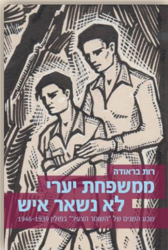
הוצאת מורשת ויד ושם